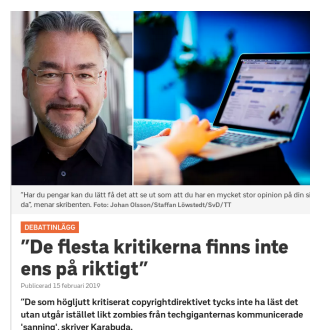
De voorzitter van een Zweedse organisatie voor belangenbehartiging van componisten, beschuldigt bewuste burgers om zombies te zijn.