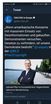
De CDU uit Duitsland beweerde dat rond 150'000 Europese burgers die protesteerde tegen de wetvoorstelling door de Amerikanen kocht worden.

Ik heb vrienden in alle delen van Europa, die samen met mij voorstanders van een sterk, democratisch en inclusieve Europese Unie zijn, maar die, door deze ontwikkelingen, nu een deuk dreigen te krijgen in hun vertrouwen in de Europese Unie.