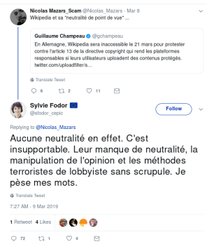
Een franse lobbyist uit Coordination of European Picture Agencies Stock, Press and Heritage (CEPIC) vergelijkt Wikimedia Duitsland met terroristen.

Voormalig Europarlementslid (2011-2014) Zweden