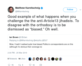
De hoofd correspondent Europa van Politico stelde voor dat burgers jihadisten worden als ze tegen de wetvoorstelling worden.